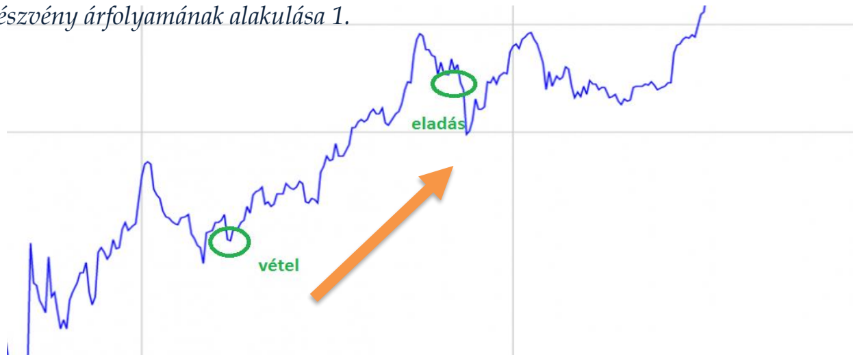
A Dzsungel részvény árfolyamának alakulása 1.